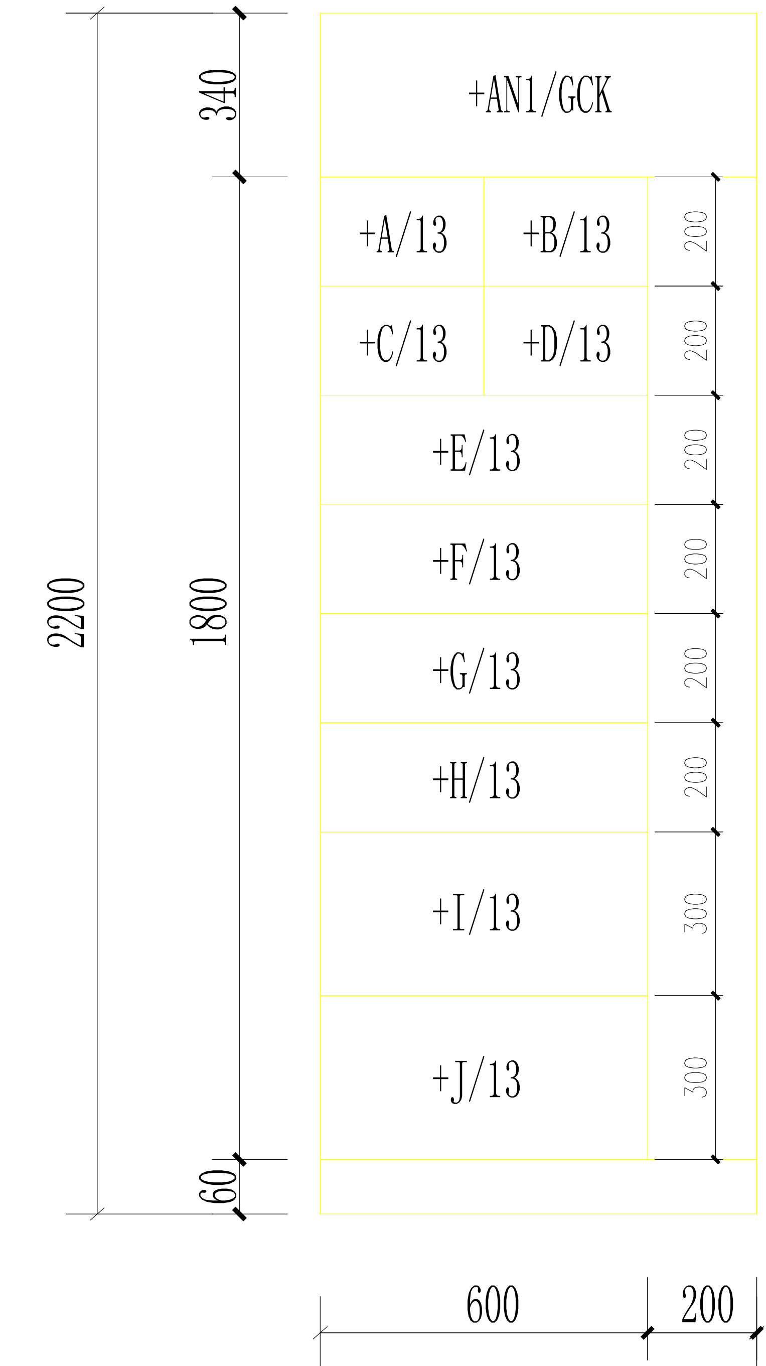
低压柜拼盘示意图